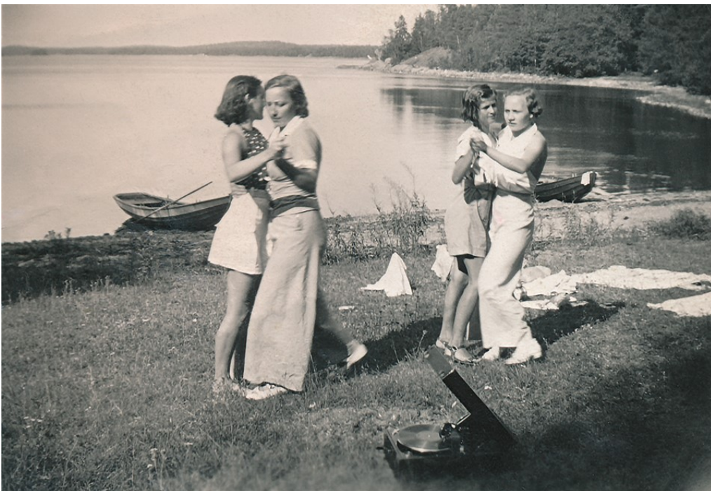
Skjortviken oli suosittu nuorison kokoontumispaikka 1920- ja 30-luvuilla. Se sijaitsee Villa Upinniemen tieoilla. Tässä tanssitaan gramofonin tahdissa 1937. VH