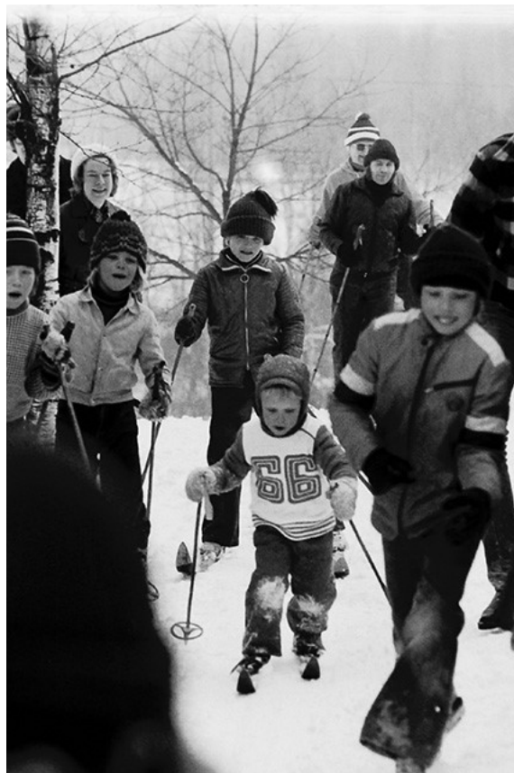
Kantvikin hiihtokisat järjestettiin usein laskiaisena aikana. Tässä kisataan Edisin kerrostalon luona 1970-luvun puolessa välissä. GH