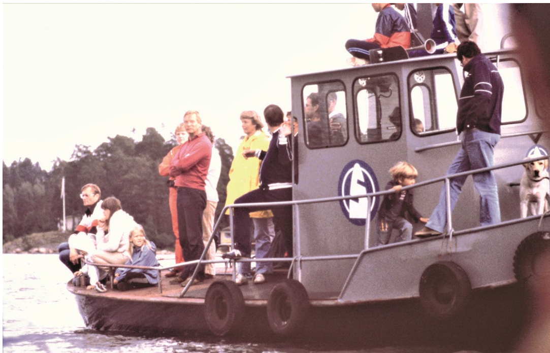
Kantvikin Purjehtijoiden Sokeri Pohjalla – on kauden viimeinen purjehduskisa. Yleisö seuraa kilpailua tehtaan hinaajan kannelta vuonna 1979. GH